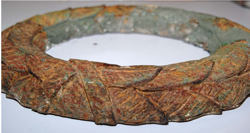
Restaurering av kransen til Maursund gård.