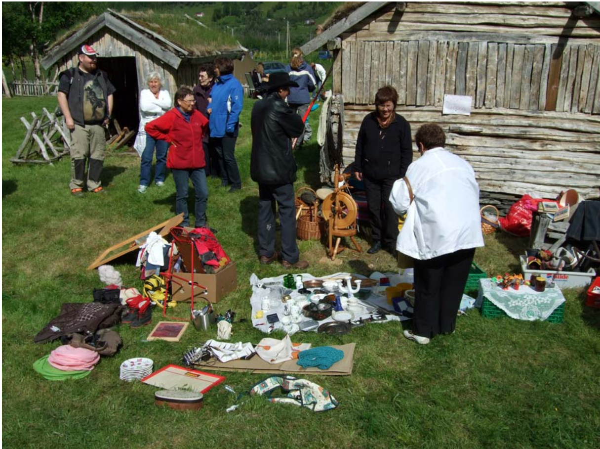
Bildet er tatt på markedsdagen på Holmenes 5.juli 2008. Årets marked var den tiende i rekken. Det var ca. 450 besøkende. Her er salget av lopper i full gang. Rundt på tunet var det salgsboder og utstillinger av diverse produkter. Besøkende kunne også få innblikk i gamle kulturtradisjoner som plantefarging, toving etc. Museet retter en stor takk til alle som støtter opp om markedsdagen!

aktiviteten samlet sett meget stort. Tilbudene er varierte, spennende og ofte utført med solid kompetanse på regionens kulturhistorie. I sommersesongen er aktiviteten i museet på topp blant faste ansatte, sommerguider og frivillige fra lag og foreninger omkring i nord-troms.